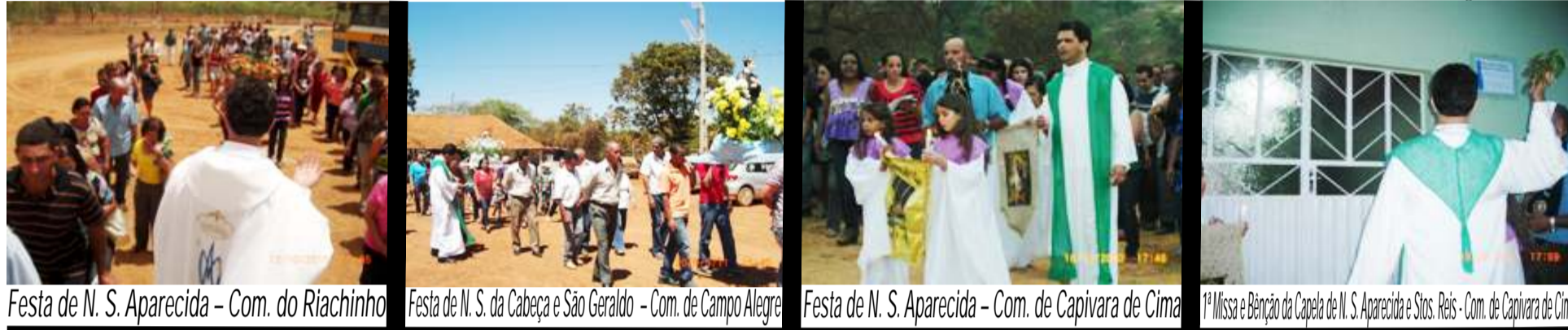
Festa de N. S. Aparecida - Com. do Riachinho Festa de N. S. da Cabeça e São Geraldo - Com. de Campo Alegre Festa de N. S. Aparecida - Com. de Capivara de Cima 1ª Missa e Bênção da Capela de N. S. Aparecida e Sítos Reis - Com. de Capivara de Cima